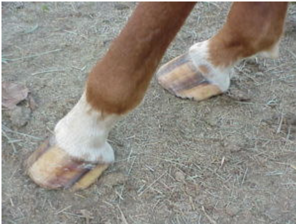
Hooves of a horse: